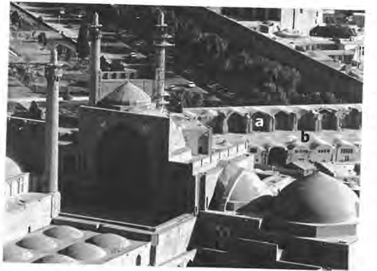
ت ۴. منظر از درون مسجد شاه به سمت شمال. a. بالاخانه‌ها b. روزن بر فراز بازار دورویه

می‌نمود. در اوایل سده یازدهم / هفدهم، میدان شاه بر لبه جنوب غربی شهر واقع و از منطقه مرکزی کسب‌وکار شهر دور بود. هر تلاشی برای آوردن تاجران و محترمان از بازار هارون‌ولایت به میدان شاه بایست با کوششهایی برای افزایش تردد از طریق میدان همراه می‌شد. کانون بازار کهنه مسجد جمعه بود — مسجد جامع بزرگی که اصل آن به زمان سلجوقیان بازمی‌گشت. طبیعی بود که شاه عباس بایست می‌کوشید مشابه آن کانون را در محدوده میدان نو پدید آورد. نشانیدن مسجد در انتهای جنوبی میدان در نقطه‌ای که اصفهانیان را وادارد دو بار از محدوده بازار نو بگذرند (یک بار برای رسیدن به مسجد و بار دیگر هنگام خروج از آن) می‌توانست بسیار مناسب باشد. این طرح مسلماً بخشی از طرحی کلی بود که شاه به‌صراحت آن را بیان می‌کرد؛ ۶۷ و آن رساندن میدان شاه به حدی بود که بر هارون‌ولایت پیشی گیرد و به مرکز اصلی کسب‌وکار در شهر تبدیل گردد.